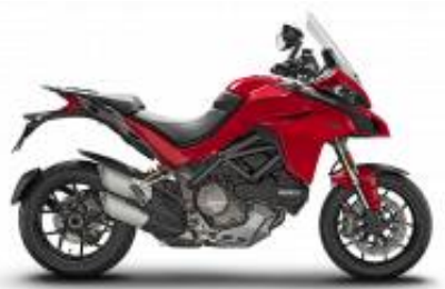
Multistrada 1260 + $532.93