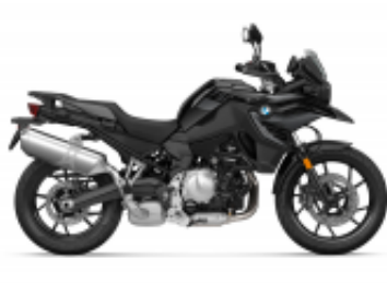
F 750 GS + $0.00