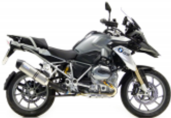
R 1200 GS LC + $479.64