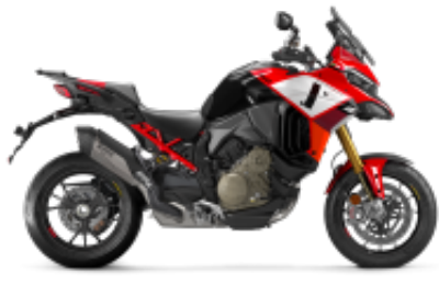
Multistrada V4 + $532.93