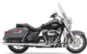
Road King Street Classic Class + $639.52