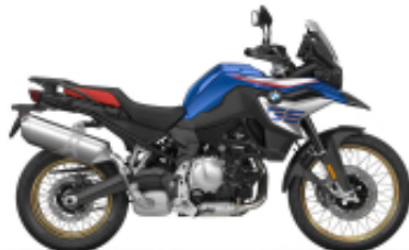
F 850 GS + $266.47