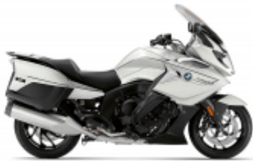
K 1600 GTL + $639.52