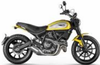
Scrambler Icon 800 + $266.47