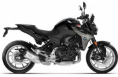
F 900 R + $0.00