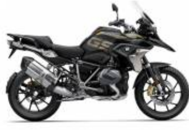
R 1250 GS LC + $532.93